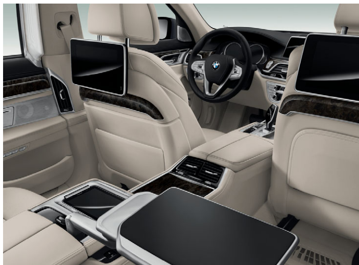
Pachet Executive Lounge